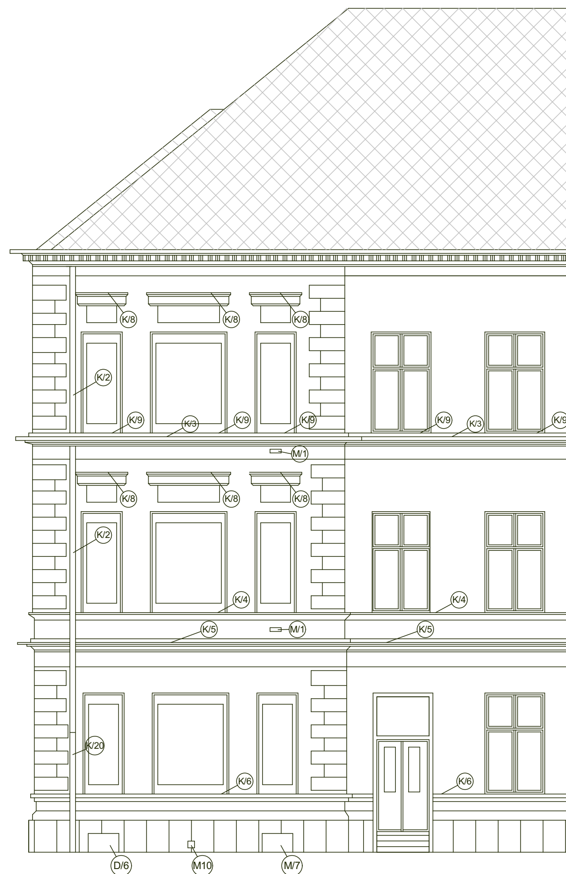
POHLED JIŽNÍ ZE DVORA M1:100